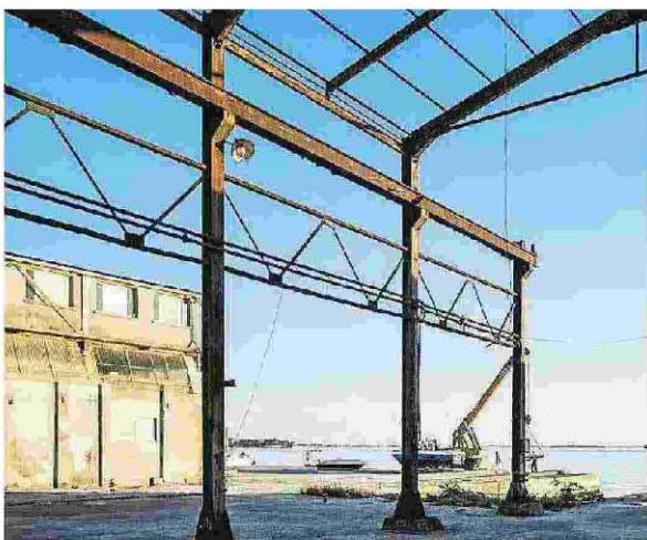
Lo spazio Consorzio Venezia Sviluppo, ex cantiere Lucchese alla Giudecca