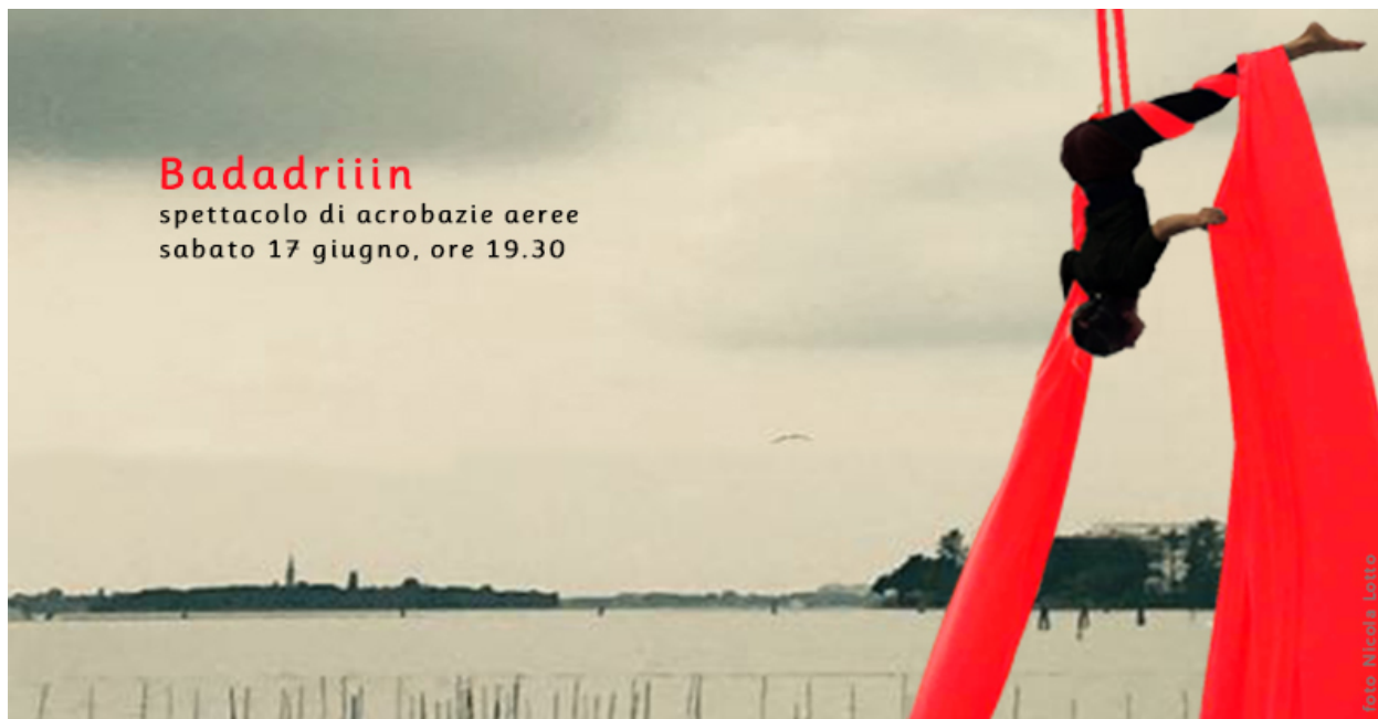
Manifesto per la diffusione