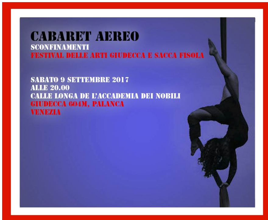
Manifesto per la diffusione